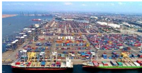
Gambar 1..3 Pelabuhan Tanjung Priok

Transportasi merupakan faktor yang sangat penting dalam penentuan lokasi pendirian pabrik. Pertimbangan mengenai fasilitas transportasi dapat menekan biaya pengeluaran seminim mungkin yang akan mempertahankan nilai ekonomis dari produk yang dihasilkan. Pabrik aspirin direncanakan didirikan di wilayah kawasan industri Jababeka 2 yang berdekatan dengan akses toll Cikampek dan juga pelabuhan Tanjung Priok, yang akan mempermudah pendistribusian bahan baku dan pengiriman produk.