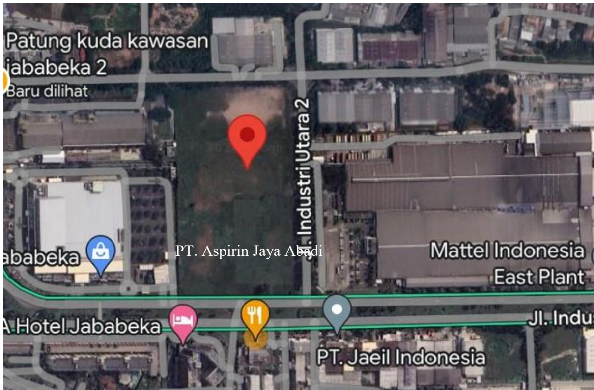
Gambar 1. 2 Lokasi Pabrik