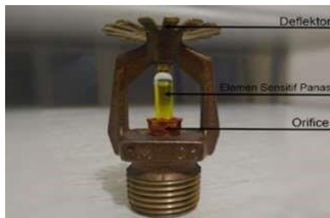
Gambar 1. Komponen utama kepala Sprinkler

Sistem proteksi kebakaran aktif adalah sistem proteksi kebakaran yang memiliki sistem pendeteksi kebakaran baik manual maupun otomatis secara lengkap. Fungsi sistem proteksi kebakaran adalah untuk memadamkan api, mengendalikan kebakaran, atau menyediakan pengendalian paparan sehingga efek lanjutan dapat dikendalikan. Sistem proteksi kebakaran ada yang beroperasi secara otomatis seperti sprinkler otomatis dan ada juga yang beroperasi secara manual seperti Alat Pemadam Api Ringan.