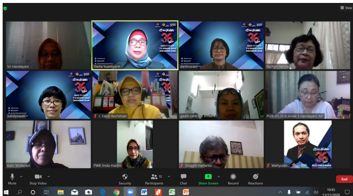
Gambar 2.1. Rapat Online Tanggal 11 Desember 2020

Beberapa foto kegiatan rapat dan tabel daftar hadir rapat ditunjukkan pada Gambar 2.1, Gambar 2.2 dan Tabel 2.3, Tabel 2.4