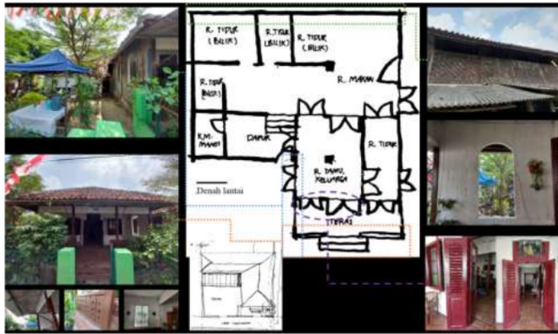
Gambar 1. Elemen ruang pada rumah Kiai Aria Wangsakara

Bangunan Rumah Kiai Aria Wangsakara memiliki konfigurasi massa bangunan L dengan struktur atap perisai. Bangunan berorientasi ke arah selatan. Massa bangunan utama terdiri dari ruang teras, ruang tamu dan keluarga, dan sebuah ruang tidur utama (Gambar 1). Sementara itu, massa bangunan utama menerus ke massa bangunan yang memanjang di belakangnya, yang terdiri dari ruang makan dan beberapa ruang tidur berupa bilik. Ruang-ruang servis, seperti dapur dan kamar mandi merupakan massa bangunan tambahan yang menempel dengan kedua massa bangunan tersebut dan dinaungi dengan atap satu bidang.