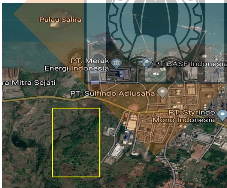
Gambar 1.4 Lokasi Pabrik di Kawasan Pulo Ampel, Banten

Dari beberapa keunggulan diatas maka kawasan industri Pulo Ampel, Serang – Banten dirasa tepat untuk lokasi pendirian pabrik.