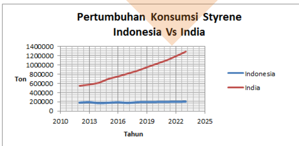
Gambar 1.3 Grafik Konsumsi Styrene Indonesia & India

Perbandingan pertumbuhan konsumsi styrene di Indonesia dengan di India bisa dilihat dari grafik gambar 1.3