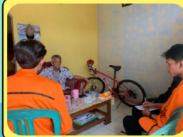
Kordinasi dengan ketua RT