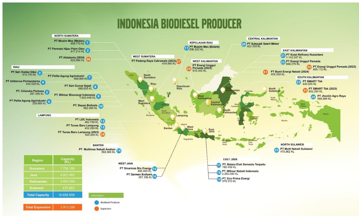
Gambar 1. 4 Produsen Biodiesel Terbesar di Indonesia (APROBI,2023)

biodiesel dimana dihasilkan 1 kg gliserol per 9 kg biodiesel atau sama dengan 10% setiap produksinya. Berdasarkan data yang didapatkan dari APROBI (Asosiasi Produsen Biofuel Indonesia) pada gambar dapat diketahui bahwa produsen Biodiesel terbesar di Indonesia terdapat di Pulau Sumatera dengan besar kapasitas produksinya sebesar 2.739.074 ton/tahun. Pabrik Triacetin yang akan dibangun berada di daerah Pelintung, Medang Kampai, Kota Dumai, Riau berdekatan dengan PT. Wilmar Bioenergi Indonesia yang merupakan pabrik biodiesel terbesar di Indonesia. PT. Wilmar Bioenergi Indonesia memproduksi biodiesel sebesar 1.603.449 KL atau 566252,67 ton/tahun.