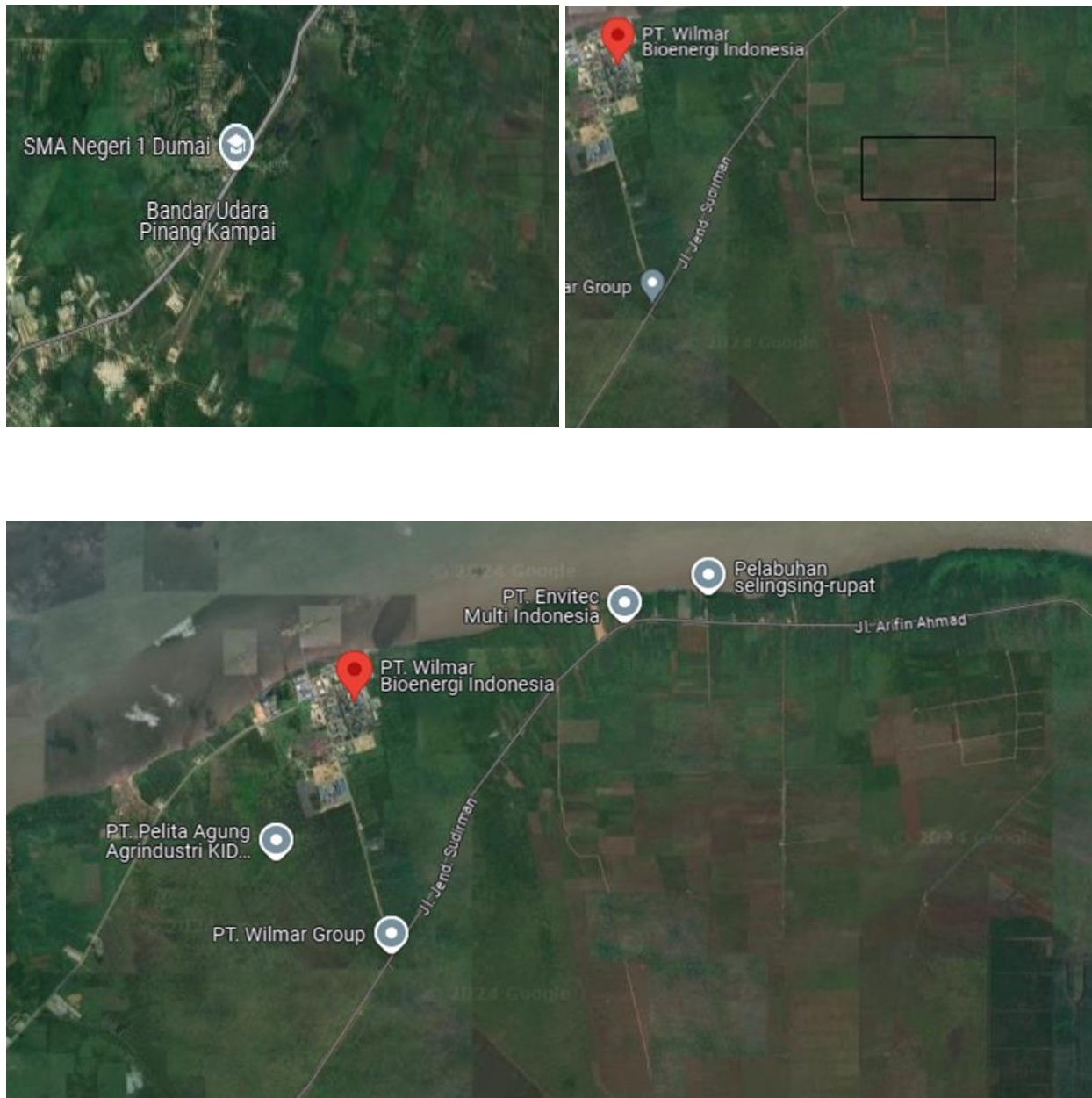
Gambar 1. 3 Lokasi Pendirian Pabrik Triacetin

Adapun faktor-faktor penentuan lokasi pabrik yang dipertimbangkan sebagai berikut: