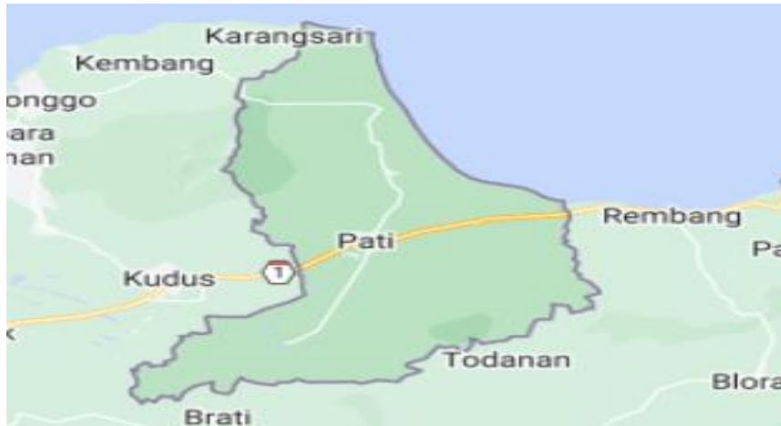
Gambar 1. 2 Peta Wilayah Pati