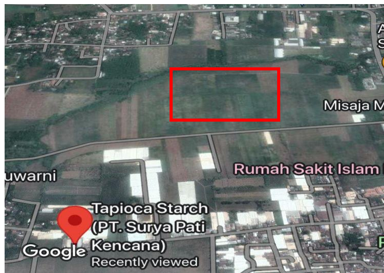
Gambar 1. 3 Rencana Lokasi Pabrik