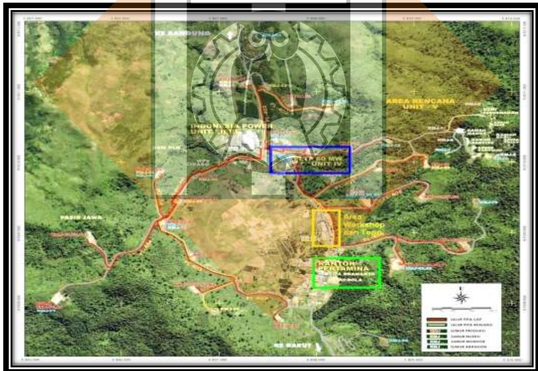
Gambar 1.1 Lokasi Lapangan Panas Bumi Pertamina Geothermal Kamojang, Jawa Barat

Pertamina Geothermal Energy (PGE) merupakan anak perusahaan PT. Pertamina (Persero), berdiri sejak tahun 2006. Lapangan pembangkit listrik tenaga panas bumi Kamojang terletak 42 km arah tenggara kota Bandung, Jawa Barat. Lapangan ini membentang pada deretan Gunung api Rakutak-Guntur dan terletak 1500 m di atas permukaan laut. Lapangan Kamojang memiliki reservoir dengan tipe sistem dominasi uap. Bentuk manifestasi panas bumi di permukaan yang ada di lapangan ini terdiri dari kolam air panas, kubangan lumpur panas, tanah beruap dan mata air panas yang tersebar di area Kamojang. Uap kering diproduksi dari reservoir sebesar 1100 ton/jam atau setara dengan 200 Mwe (Laporan Harian Fungsi Produksi PT.Pertamina Geothermal Energy (PGE) area Kamojang, 2013)