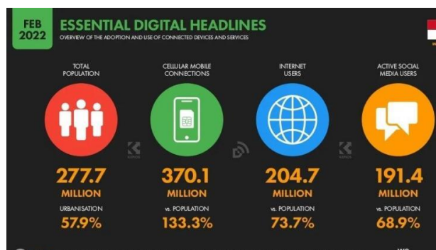
Gambar 1.1 Penggunaan Internet di Indonesia Tahun 2022

Perkembangan zaman yang kian pesat serta kemajuan teknologi yang kian maju perlu diikuti pula dengan perkembangan sumber daya manusia yang baik terlebih lagi saat ini memasuki era revolusi industri 4.0 dimana perkembangan teknologi digital yang berkembang menjadi pusat dari segala aktivitas. Revolusi industri 4.0 secara langsung dan tidak langsung mempengaruhi berbagai bidang industri untuk berkembang melalui teknologi digital dan internet, salah satunya adalah dalam perekonomian. Ekonomi kreatif hadir sebagai solusi yang menempatkan kreativitas dan pengetahuan sebagai aset utama dalam menggerakkan ekonomi yang memunculkan sebuah pandangan baru dalam berusaha. Salah satu bidang industri ekonomi kreatif adalah startup. (Timothy, Mieke Choandi, 2019)