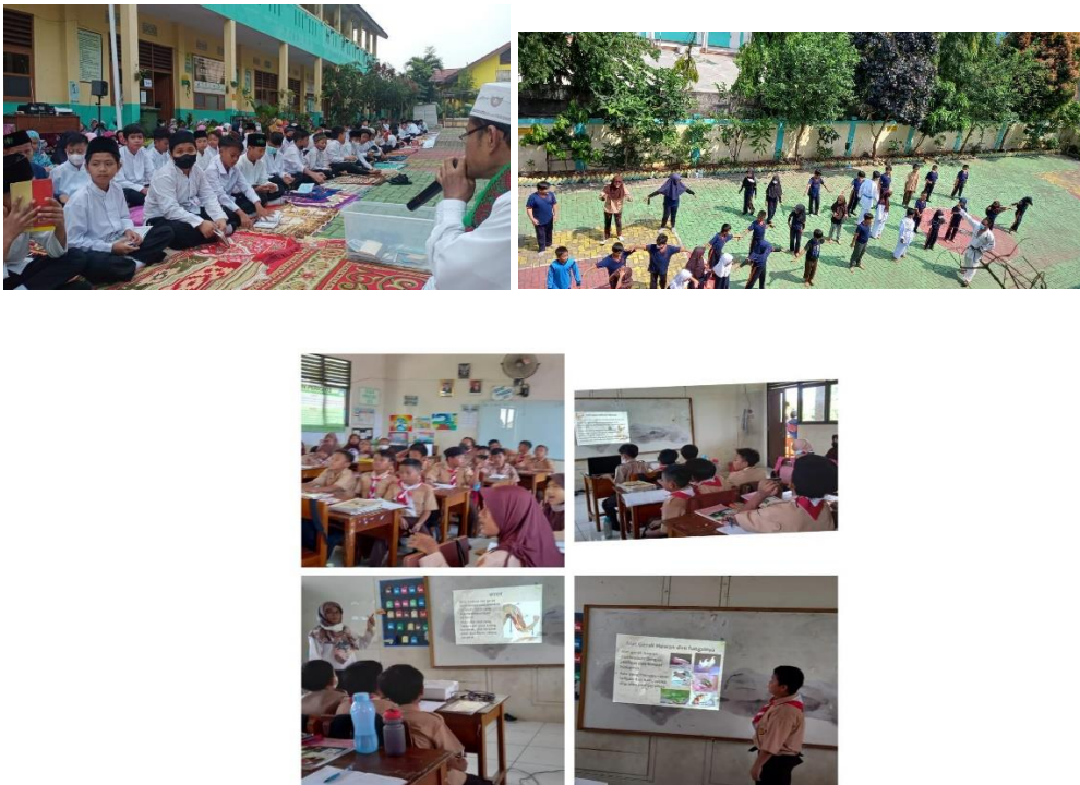
Gambar 2. Aktivitas Siswa Yang Berada Diluar maupun Didalam Ruang pada Tahun 2022

bangunan sekolah lain dengan bangunan SDN 02 dan 03 tetapi sekarang sudah ada pembatas yang mengakibatkan lahan sekitar bangunan SDN 02 dan 03 menjadi sempit sehingga tidak sebanding dengan kebutuhan akan fasilitas atau sarana prasarana untuk pendidikan siswa yang dari tahun ke tahun semakin bertambah. Sekolah Dasar Negeri Parigi 02 dan 03 desain bangunannya seperti bangunan sekolah negeri pada umumnya yang berada di kota Tangerang Selatan bila dibandingkan dengan sekolah swasta pada umumnya masih sangat sederhana dan terkesan kurang menarik.