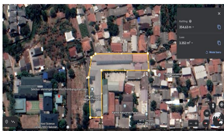
Gambar 3. Google Earth Lokasi SDN Parigi 02 dan 03

Lokasi yang akan digunakan sebagai obyek desain perancangan berada di Jalan Taman Makam Bahagia Abri, Perigi Lama, Pondok Aren, Tangerang Selatan.