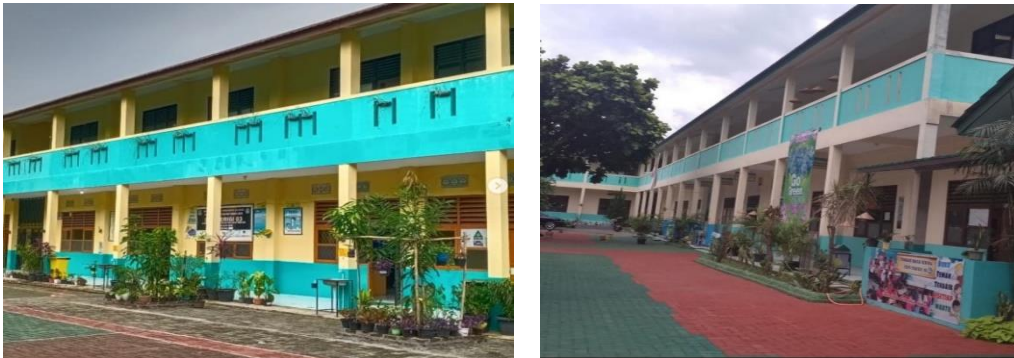
Gambar 1. Sekolah Dasar Parigi 02 dan 03 2022

Pendidikan sekolah dasar adalah pendidikan anak yang berusia 7 sampai 13 tahun sebagai pendidikan ditingkat dasar yang dikembangkan sesuai dengan satuan pendidikan, potensi daerah dan soaial budaya. Salah satunya adalah Sekolah Dasar Negeri yang berlokasi di Jl. Taman Makam Bahagia Abri, Perigi Lama, Pondok Aren. SDN Perigi 02 dan 03 merupakan sekolah dasar yang menjadikan warga sekolah memiliki karakter taqwa iman tawakal dan ikhlas dengan program sekolah adiwiyata di Kota Tangerang Selatan Provinsi Banten dan menuju Tingkat Nasional.