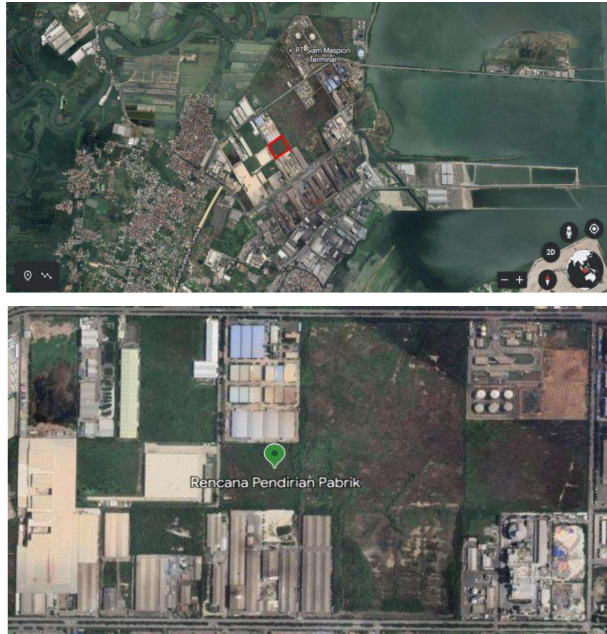
Gambar 1.1 Lokasi Pendirian Pabrik Propilen Glikol